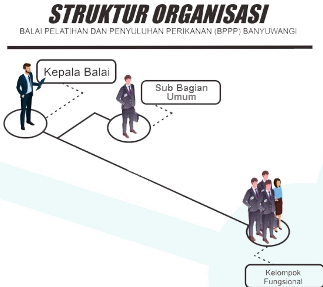
Gambar 2. Struktur organisasi BPPP Banyuwangi Tahun 2021

Berdasarkan SK Menteri Kelautan dan Perikanan Nomor : PER- 87/PERMEN-KP/2020 tanggal 28 Desember 2020 tentang Organisasi dan Tata Kerja Balai Pelatihan dan Penyuluhan Perikanan. Balai Pelatihan dan Penyuluhan Perikanan (BPPP) Banyuwangi dipimpin oleh kepala balai yang merupakan jabatan struktural eselon III-a atau jabatan administrator dengan struktur organisasi terdiri atas Sub bagian umum dan kelompok jabatan fungsional. Struktur organisasi BPPP Banyuwangi dapat dilihat pada gambar berikut :